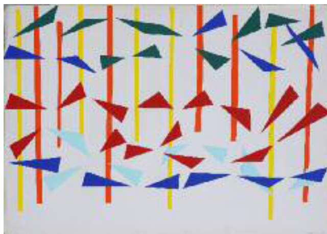
Da "La Caccia" di Paolo Uccello, 1968, collage con carte plastificate, cm. 50 x 72,6