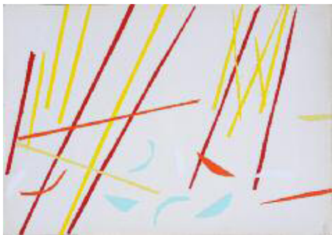
Da "la Battaglia di San Romano" di Paolo Uccello, 1968, collage con carte plastificate, cm. 50 x 72,6.